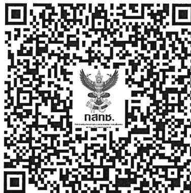
รูปแบบไฟล์ Excel

ส่วนที่ ๕ ข้อมูลของผู้ผ่านการอบรมในรูปแบบไฟล์ Excel ตามที่สำนักงาน กสทช. กำหนด